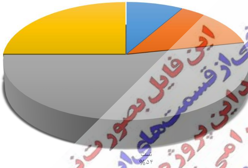
نوع کتاب‌های کمک درسی