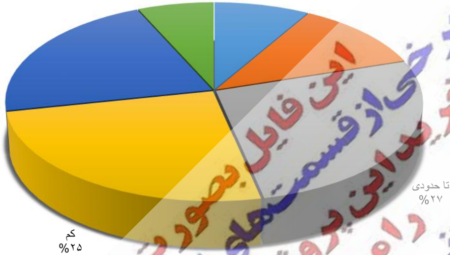
میزان تأثیر کتاب‌های کمک درسی بر موفقیت دانش‌آموزان