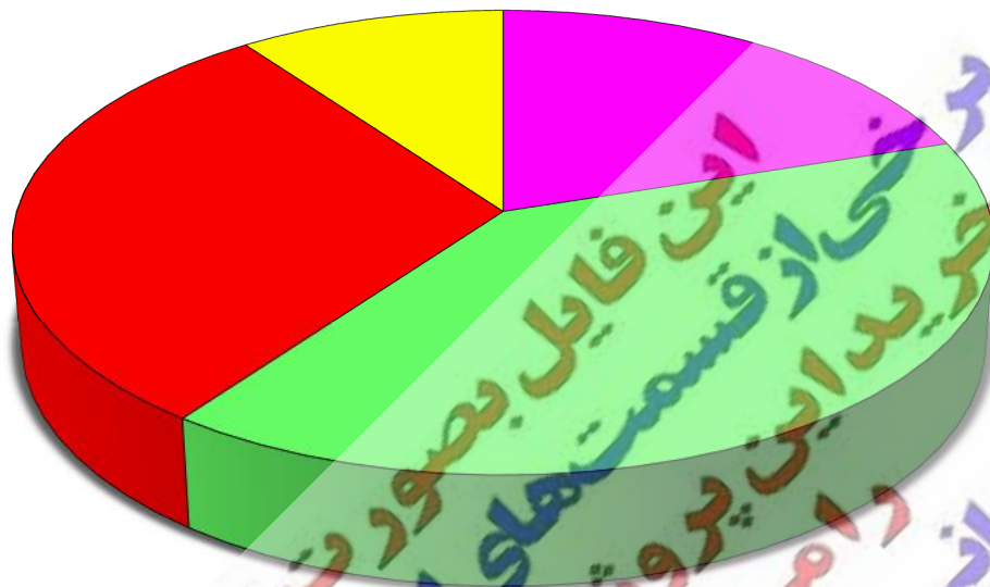
تعداد شرکت کنندگان در نماز جماعت مدرسه