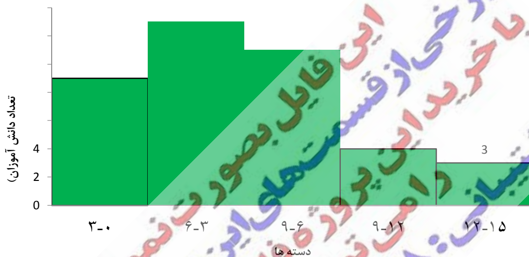
تعداد مراجعات به مشاور دبیرستان